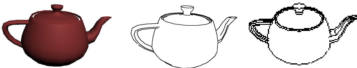
Abbildung 4: 3D-Rendering, 2D-Liniendarstellung und tastbare Aufbereitung des Utah Teapots

sem Verfahren wurde das System aus Abschnitt 4.2 um die Möglichkeit erweitert, die Liniengraphiken, die vom Server berechnet werden, in XML-basierte Graphiken im SVG-Format umzuwandeln. Diese lassen sich dann mit dem herkömmlichen Verfahren als SVG auf einem taktilen Ausgabegerät für blinde Menschen anzeigen. Für die interaktive Steuerung ist ein spezieller 3D-Modus notwendig, der Rotationen um die drei Achsen und das Zoomen ermöglicht. Abb. 4 zeigt den Utah Teapot als 3D-Graphik gerendert, in der 2D-Liniendarstellung und als tastbare 2D-Graphik, die für blinde Menschen aufbereitet wurde. Weitere Forschungen in diesem Bereich sind in [KaTo1996, Kurz1997] zu finden.